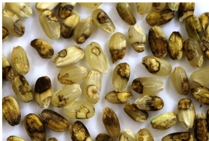
写真2 ミナミアオカメムシの吸汁加害による斑点米粒

(3) ミナミアオカメムシは他の斑点米カメムシ類に比べて体が大きく吸汁量が多いため、少数でも被害が大きくなるので注意する。