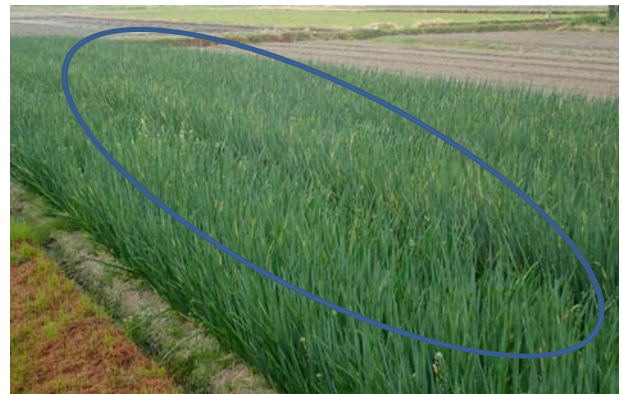
写真2 今春のネギべと病の発生状況 (枠内：発生箇所)