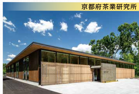
京都府茶業研究所

京都府の重要特産物である宇治茶について茶業者の経営の安定向上と消費者ニーズに応えるため、高品質化とともに品種育成、環境保全、省力化、製品開発を主とした研究開発に取り組んでいます。