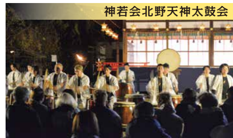
神若会北野天神太鼓会

京都最古の花街・上七軒は北野天満宮のお膝元、東参道に広がるお茶屋の街で、織物の街・西陣の奥座敷として繁栄を極め、今日も先人の意思と伝統を受け継ぎ、芸道精進に努めています。