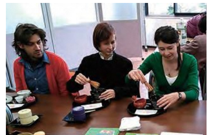
外国人の文化体験