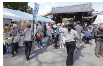
京都・和食の祭典

和食のユネスコ無形文化遺産登録や東京2020オリンピック・パラリンピック競技大会、2025年日本国際博覧会（大阪・関西万博）の開催決定など、日本と日本の文化が世界中から注目されていることから、この機会を捉えて、伝統産業やコンテンツ産業、食産業、観光など、京都府内の特色である文化関連産業の振興を図るとともに、発信力を強化します。