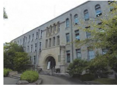
文化庁の移転先となる現京都府警察本部本館

国においては、東京一極集中の是正と地方創生に向けて、文化庁の京都への全面的な移転が平成28（2016）年3月に決定され、翌年4月には先行移転として「文化庁地域文化創生本部」が京都に設置されました。