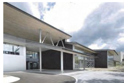
文化・学習交流拠点「京都府立京都学・歴史館」