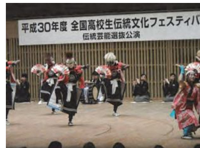
全国高校生伝統文化フェスティバル