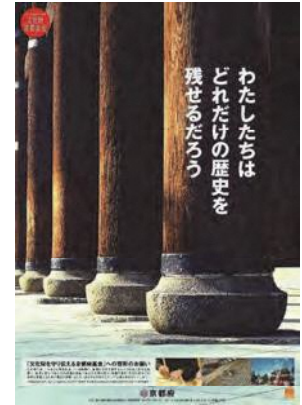
文化財を守り伝える京都府基金