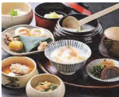
ユネスコ無形文化遺産 和食

映画やアニメ、マンガ、ゲームといったコンテンツをはじめ、ユネスコ無形文化遺産に登録された和食など、日本文化への関心が世界中から集まっています。