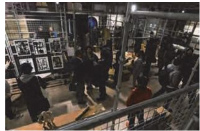
「ARTISTS' FAIR KYOTO」