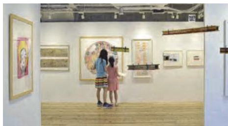
きょうと障害者文化芸術推進機構の作品展示