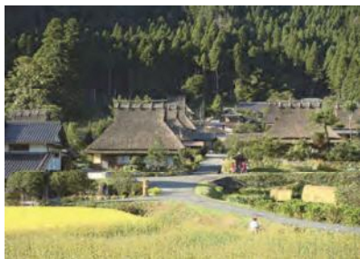
美山・かやぶきの里

京都府の中部地域（福知山市、綾部市、亀岡市、南丹市、京丹波町、京都市右京区京北）は、森林率が約8割を占めるなど、「森」の恵みが大変豊かで、森や木と関わるなかで、豊かな生活・文化が育まれ、発展してきた地域です。また、「森」は「海の京都」から都への文化の通り道でもあり、「森」と関わる豊かな生活・文化を伝えてきた地でもあります。