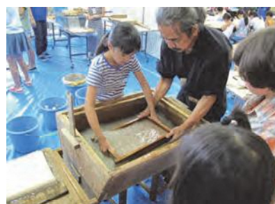
子どもたちの文化体験プログラム