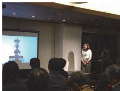
「京都アートラウンジ」での作家による作品紹介