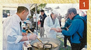
1 祇園さゝ木一門会 大根炊き、粕汁