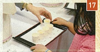
17 料亭の「ほんまもの出汁」試飲 2/24(土) 魚三樓、たん熊北店、美濃吉、山ばな平八茶屋 2/25(日) 木乃婦、清和荘、天崑、萬重