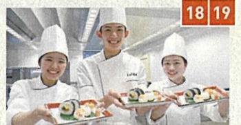
18 19 京都製菓製パン技術専門学校 京都調理師専門学校 みたらし団子 京野菜と三太郎大根の京風ビーフシチュー 京野菜と鶏つくねのあったかみぞれ鍋