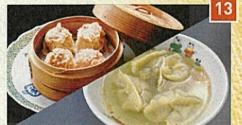
13 創作中華 一之船入 特製肉焼売、スープ水餃子