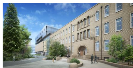
※文化庁移転施設イメージ図