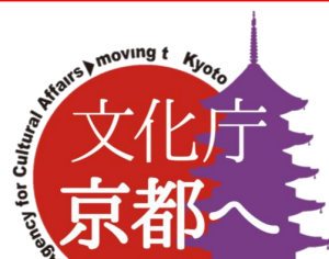
※文化庁京都移転ロゴマーク