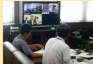
文化庁とのテレビ会議の様子