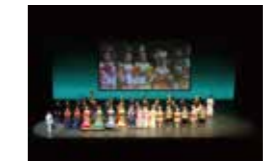
(写真：東アジア文化都市2017京都公演)