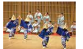
(写真：第5回全国高校生伝統文化フェスティバル)