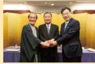
左から、門川市長、立石京都商工会議所会頭、山田知事

平成 28 年 3 月 22 日 政府のまち・ひと・しごと創生本部において移転の必要性や効果について検証が行われ、「政府関係機関移転基本方針」が決定