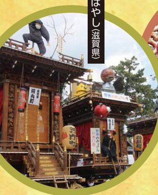
水口ばやし(滋賀県)