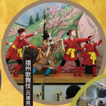
播州歌舞伎(兵庫県)