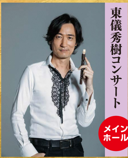
東儀秀樹 コンサート