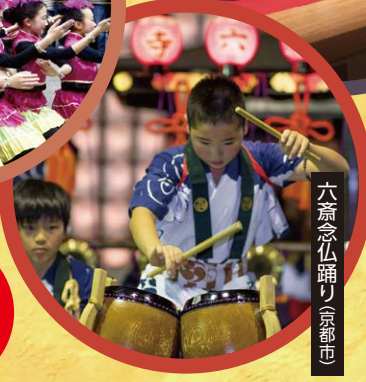
六斎念仏踊り(京都市)