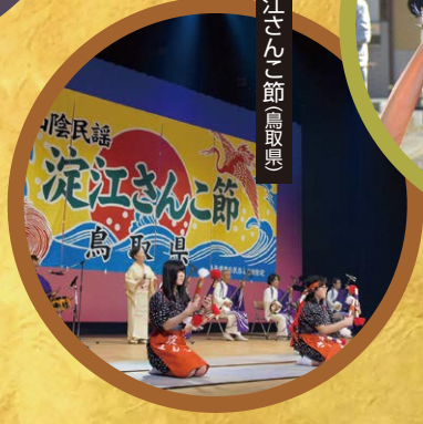
淀江さんご節(鳥取県)