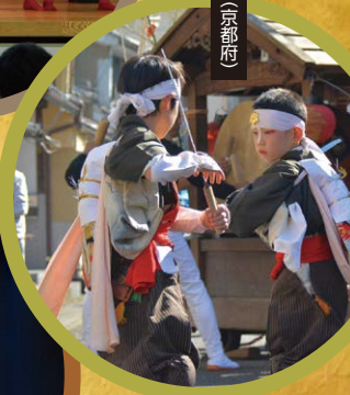
吉原の太刀振(京都府)