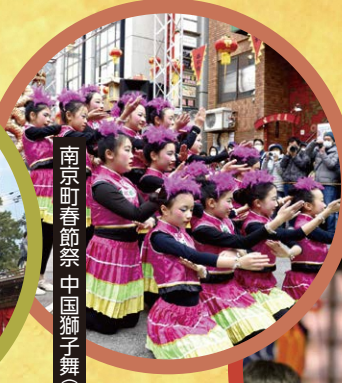
南京町春節祭中国獅子舞(神戸市)