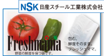
NSK 日産スチール工業株式会社