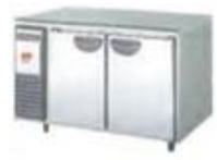
SHUT-MAN SHUT-MAN SHUT-MAN

申込方法 締め切り 令和3年 10月27日(水)必着 ※参加申込される方は、プラットフォーム会員に登録させていただきますので、ご承知おきください。