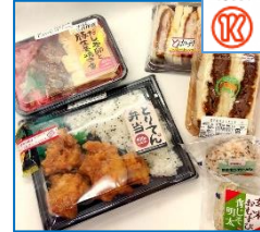
明日につながる食文化。 角井食品