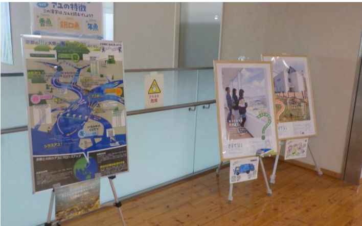
展示スペース(3)の設置イメージ