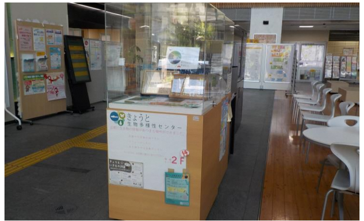
展示スペース(4)の設置イメージ