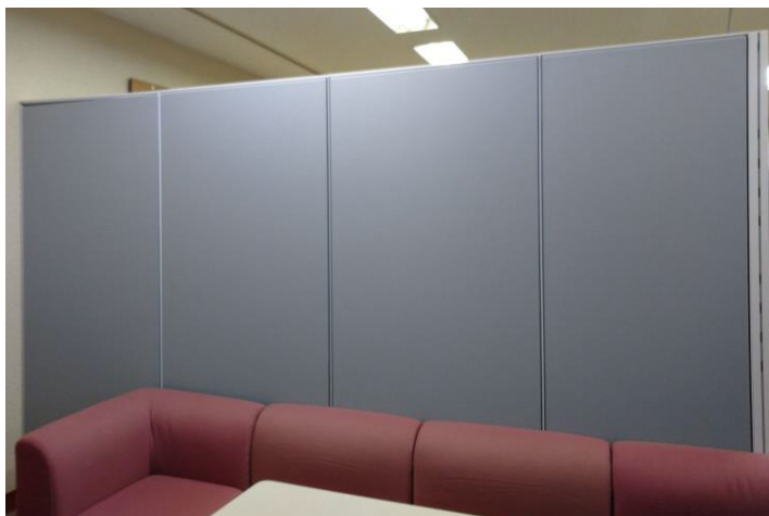
展示スペース(5)バックパネル