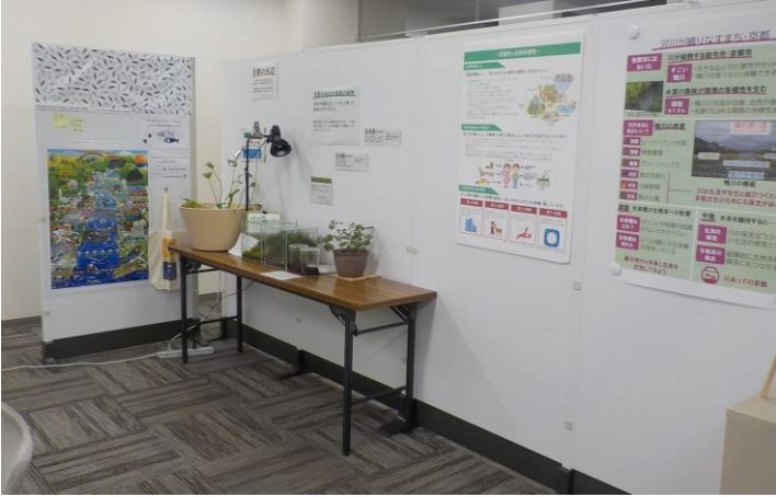
展示スペース(1)及び(2)の設置イメージ