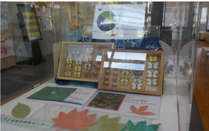
展示スペース(4)の設置イメージ