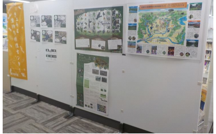
展示スペース(1)は裏面にも展示可能