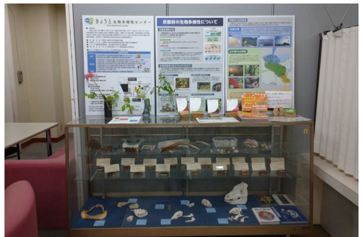
展示スペース(5)ショーケース