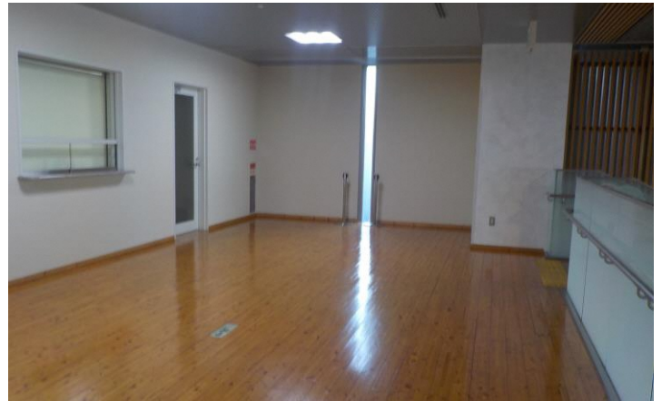
(3)は階段を上ってすぐの場所にも設置可能