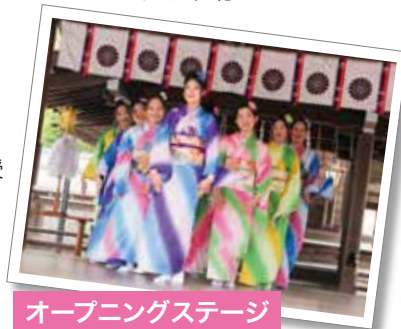
オープニングステージ

■都合により、当日の出演者を変更する場合がございます。あらかじめご了承ください。