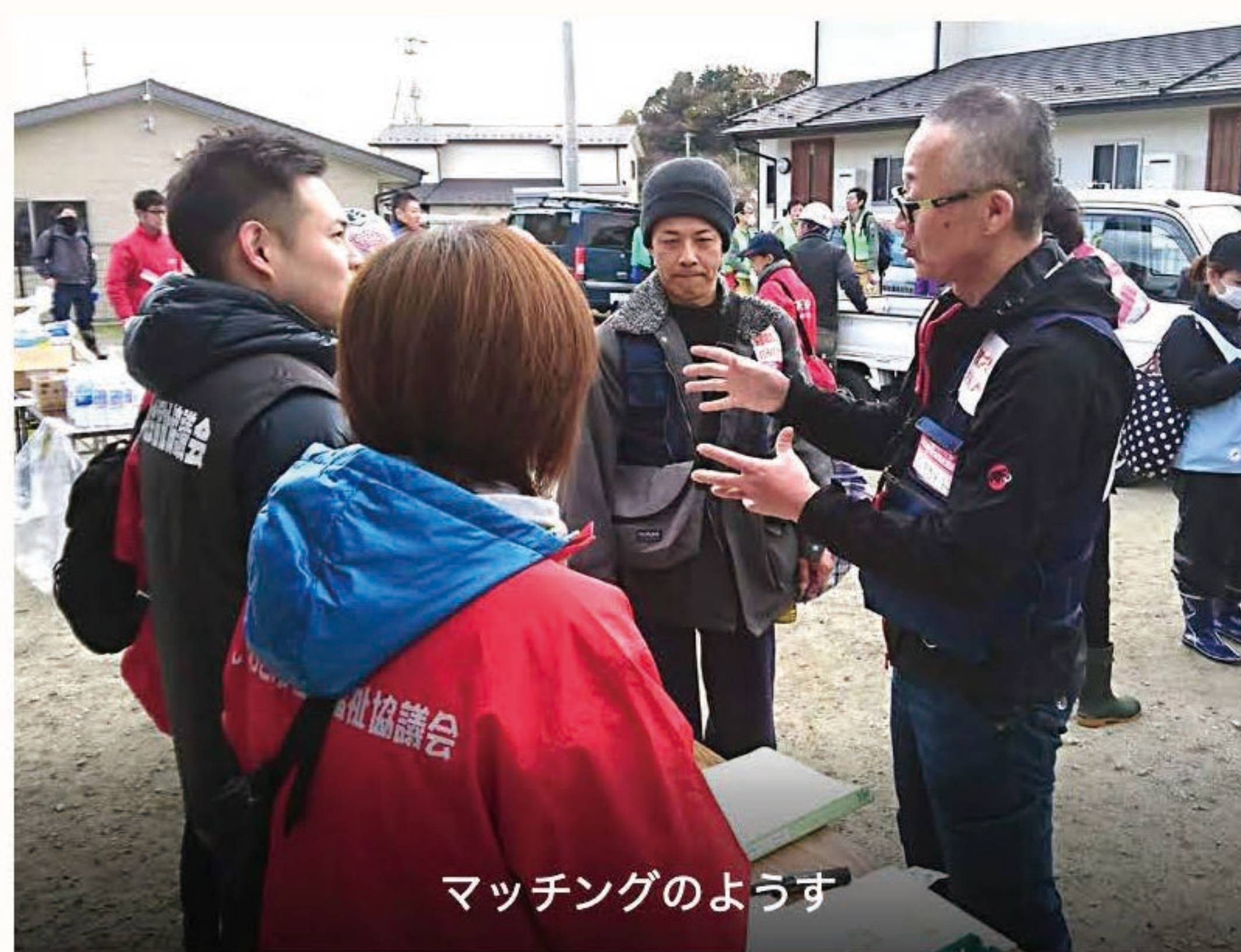
マッチングのようす