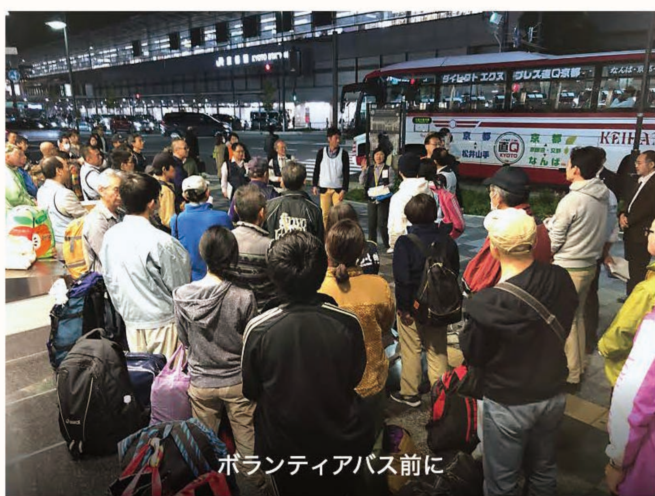
ボランティアバス前に