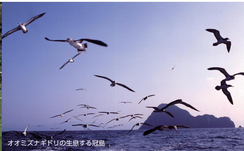
オオミズナギドリの生息する冠島

京都府環境影響評価条例に基づく手続が適正かつ円滑に実施されるよう、 事業者や住民のみなさんの御理解と御協力をお願いいたします。