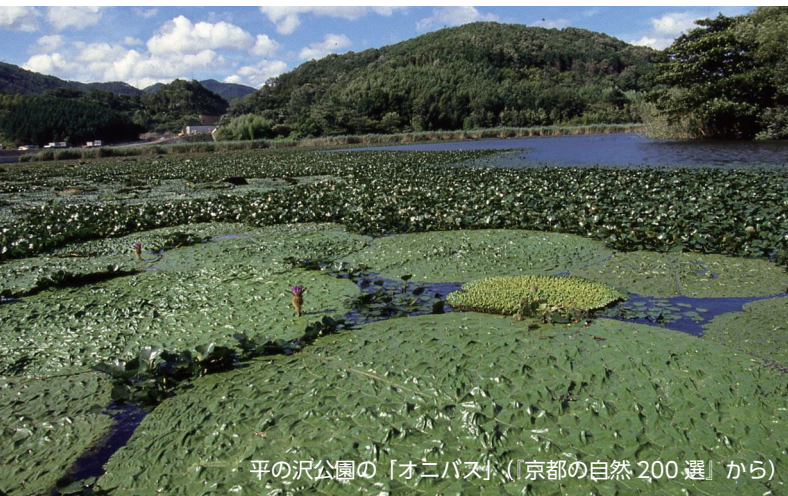
平の沢公園の「オニバス」(「京都の自然200選」から)