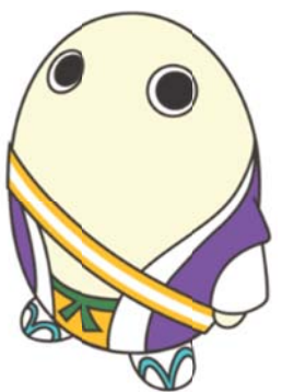
京都府広報監 まゆまろ